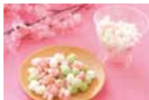
▲ 쌀로 만든 화과자 히나 아라레

여자 아이가 행복하게 성장하는 것을 기원하는 축제입니다. 히나 닌교라는 기모노 차림의 인형을 장식하고 히나 아라레 (화과자) 나 치라시 즈시 (조밥) 를 먹습니다.