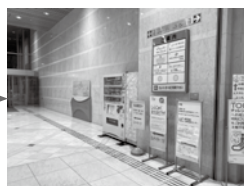
②왼쪽으로 돌아 들어가면