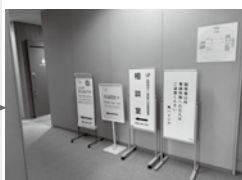
④ 11 층으로 올라가서