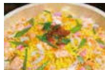
▲ 치라시 즈시는 찰밥에 다양한 재료를 얹은 조밥의 한 종류입니다