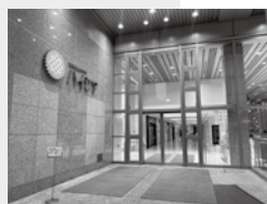
①정면 입구로 들어가서...