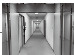
⑤간판의 화살표를 따라 안쪽까지 가면