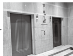
③엘리베이터 홀에 도착!