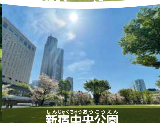
しんじゅくちゅうおうこうえん 新宿中央公園