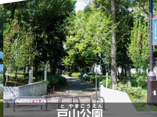
とやまこうえん 戸山公園

豊かな自然を楽しめる、市内でも人気のピクニックスポット。自然の美しさを生かした日本庭園もおすすめです。 注意事項：酒類持込禁止、喫煙禁止、遊具類使用禁止 (こども広場除く)