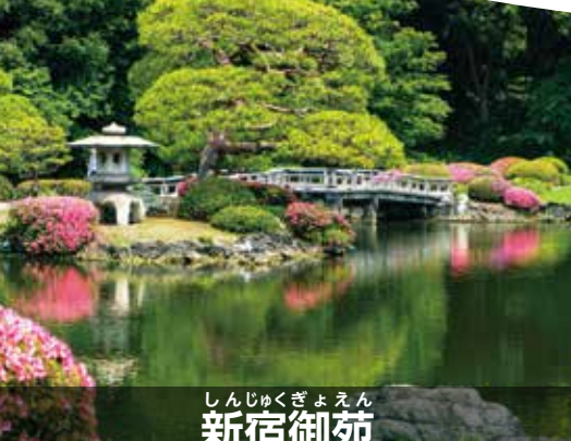
しんじゅくぎょえん 新宿御苑