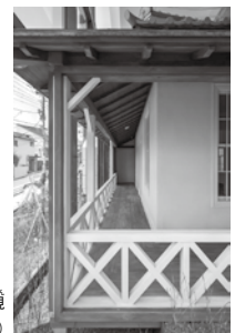
漱石山房再現 (ペランダ式回廊)