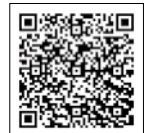
(英語・中国語・韓国語)

新宿区立の図書館で読むことができます。 詳しくはHPをご覧ください。 http://www.foreign.city.shinjuku.lg.jp/jp/goraku/goraku_25/