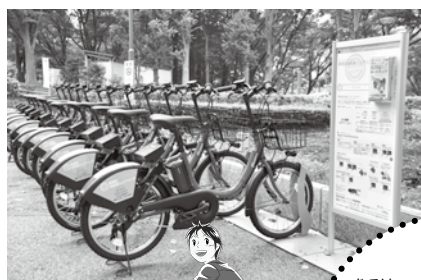
新宿中央公園【ポケットパーク】のサイクルポート

最近、街中で赤い小型の自転車を見かけることはないでしょうか。この自転車は、会員登録をすれば好きな時に借りることができる自転車シェアリングサービスの電動アシスト付自転車です。新宿区・千代田区・中央区・港区・江東区などのサイクルポートでも利用できます。サイクルポートは2017年3月31日までに新宿区内に20カ所以上設置する予定です。ぜひご利用ください。