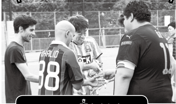
スタッフに聞きました

しんじゅく 新宿区でフットサルをしてみたいけれど、どこに行けばいいの? 日本人と友だちになりたい! 留学生の友だちがほしい!