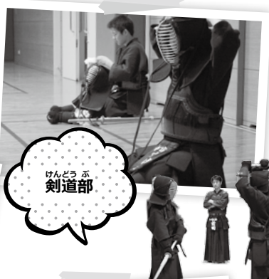
けんどうぶ 剣道部