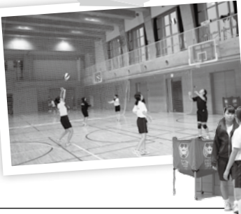
じよしよ 女子バレー ボール部

日本の中学校・高校では、生徒の学習意欲の向上や責任感・連帯感・社会性を養うため、授業の後などに、自主的・自発的な参加による「部活動」を行っています。野球・陸上・水泳・柔道・剣道などの運動系と、吹奏楽・合唱・科学・写真・茶道などの文化系の活動があります。なお、学校により部活動の種類は異なります。