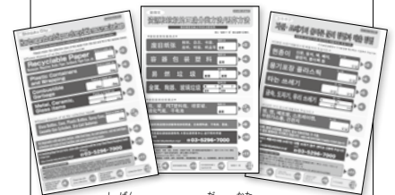
▲資源やごみの出し方について 外国語(英語・中国語・韓国語)の案内

また、区役所では、資源やごみの出し方について外国語(英語・中国語・韓国語)の案内を配布していますので、ぜひご利用ください。