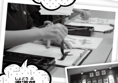
しやどうぶ 書道部