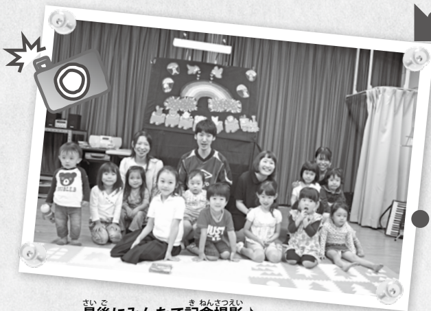
③ 最後にみんなで記念撮影! 「楽しかった!」「また来たい!」