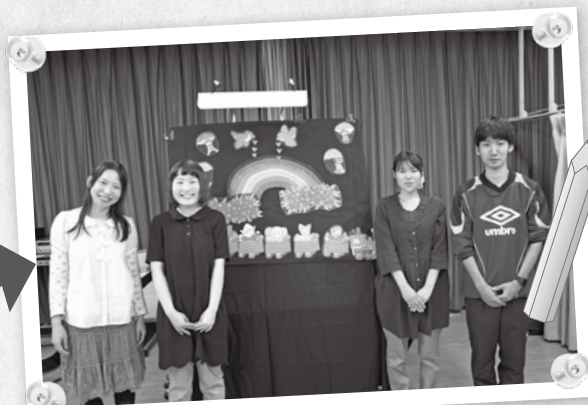
④ 上演してくれた、パネルシアターサークル「でんでん虫」のみなさん。 「みんなの喜ぶ顔が見られてとても嬉しい!」

歌やお芝居を多言語で楽しむことで、様々な文化に触れることができます。また、友達を作るチャンスですよ! みなさんもぜひ参加してみませんか?