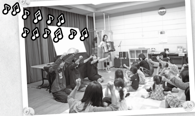
① 英語の歌を熱唱! 「If you're happy~♪」みんなで盛り上がりよう!

当日は、37名の方が参加し、パネルシアターや英語での合唱を楽しみました。最初は緊張していた子どもたちも、パネルの上で次々と動く絵や文字に次第に引き込まれていき、英語での合唱も終盤に向けて大合唱となり、大変な盛り上がりを見せました。