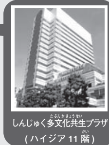
しんじゅく多文化共生プラザ (ハイジア11階)