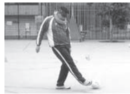
ブラインドサッカー