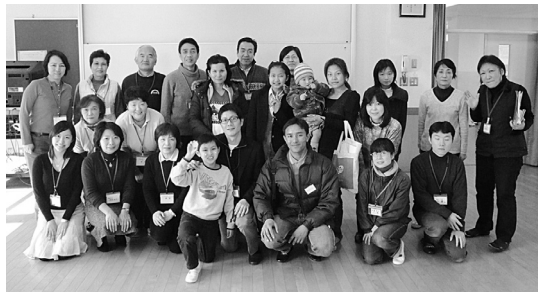
▲ボランティアと参加者の皆さん

の孤独感と子育ての苦労を同時に体験しました。その時、現地の方にいると助けてもらったのです。日本で生活する外国人も当時の私と同じような不安や悩みを抱えていると思います。ボランティアだけでなく、参加者同士も支えあうような教室にできれば素晴らしいですね。