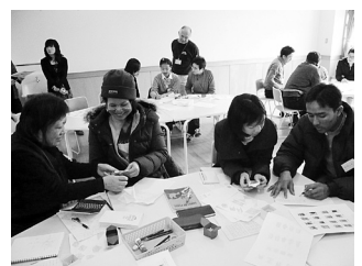
▲隣でボランティアが丁寧に教えてくれる

ボランティアに参加したい方、外国人の視点でアドバイスをしてくださる方も大歓迎です。