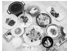
季節の会席料理 の楽しみます。