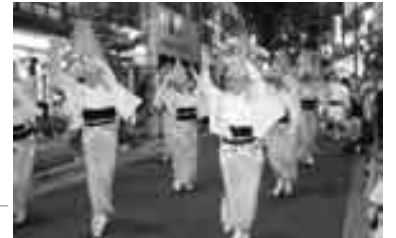
神楽坂の阿波踊り

○19～22日 神楽坂まつり(ほおすき市・阿波踊り) ○中旬 ホテル鑑賞と夜のおとめ山公園=おとめ山公園 ○29日 新宿エイサーまつり(沖縄の伝統的な盆踊り)= 新宿通りほか