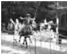
うまから矢を射る流鏝馬

○1～15日 大新宿区まつり(パレード、大道芸ほか) ○9日 スポレク(スポーツ体験、プール開放ほか)=新宿スポーツセンターほか ○9日 高田馬場流鏝馬=穴八幡宮 ○9日 大久保まつり、百人町まつり=大久保通り ○上旬 大高田馬場まつり(サンバほか)=高田馬場駅前広場周辺 ○上旬 若松ふれあい まつり=若松地域センター ○15日 ふれあいフェスタ=都立戸山公園ほか ★新宿区日本語教室開始(後期)=区内8会場 ◆区立中学校の一斉学校公開と学校説明会(第2回) ◆学校選択制度の受付を開始(中学校) ◆中旬～11月上旬 幼稚園4月入学園児募集