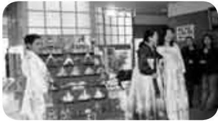
お 折り紙などで遊んで、あそ 華道や茶道、かどう 書道、さどう 水墨画、しよどう 着物の

にほん 伝統文 化を楽しんでみ ませんか？ きれ いな雛飾りや楽 しい阿波踊りを 見て、輪投げや