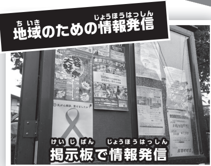
地域のための情報発信