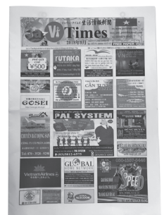
Ja Vi Times

という思いから続けています。大久保周辺のベトナム料理店や食料品店などで配布していますので、見かけたら手に取ってみてください。