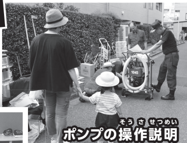
ポンプの操作説明

ぼうさいしき くんれんたいせい ぼうさい ちいき 防災組織・訓練体制の強化を地域で 行い、災害に強いまちづくりに取り 組んでいます。