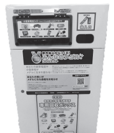
本庁舎1階の回収ボックス

【URL】 http://www.foreign.city.shinjuku.lg.jp/seikatsu/seikatsu_29/