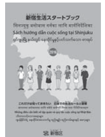
日本語・ネパール語・ベトナム語・ミャンマー語版