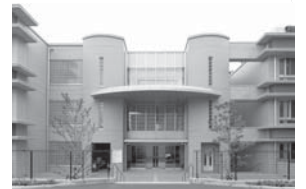
子ども総合センター

http://www.foreign.city.shinjuku.lg.jp/jp/ikuji/ikuji_21/