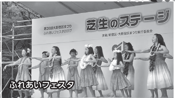
ふれあいフェスタ