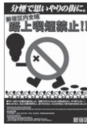
路上喫煙禁止ポスター

新宿区では定められた場所を除き区内全域で路上での喫煙を禁止しています。公園や広場などでも他人に受動喫煙をさせないように注意しましょう。煙が拡散することで周囲の人に迷惑や被害を与えるおそれがあります。