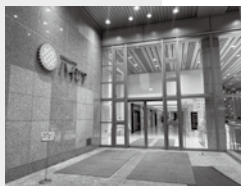
① 正面入口に入って...