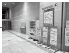
② 左にまわりこむと