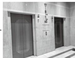
③ エレベーターホールに到着！