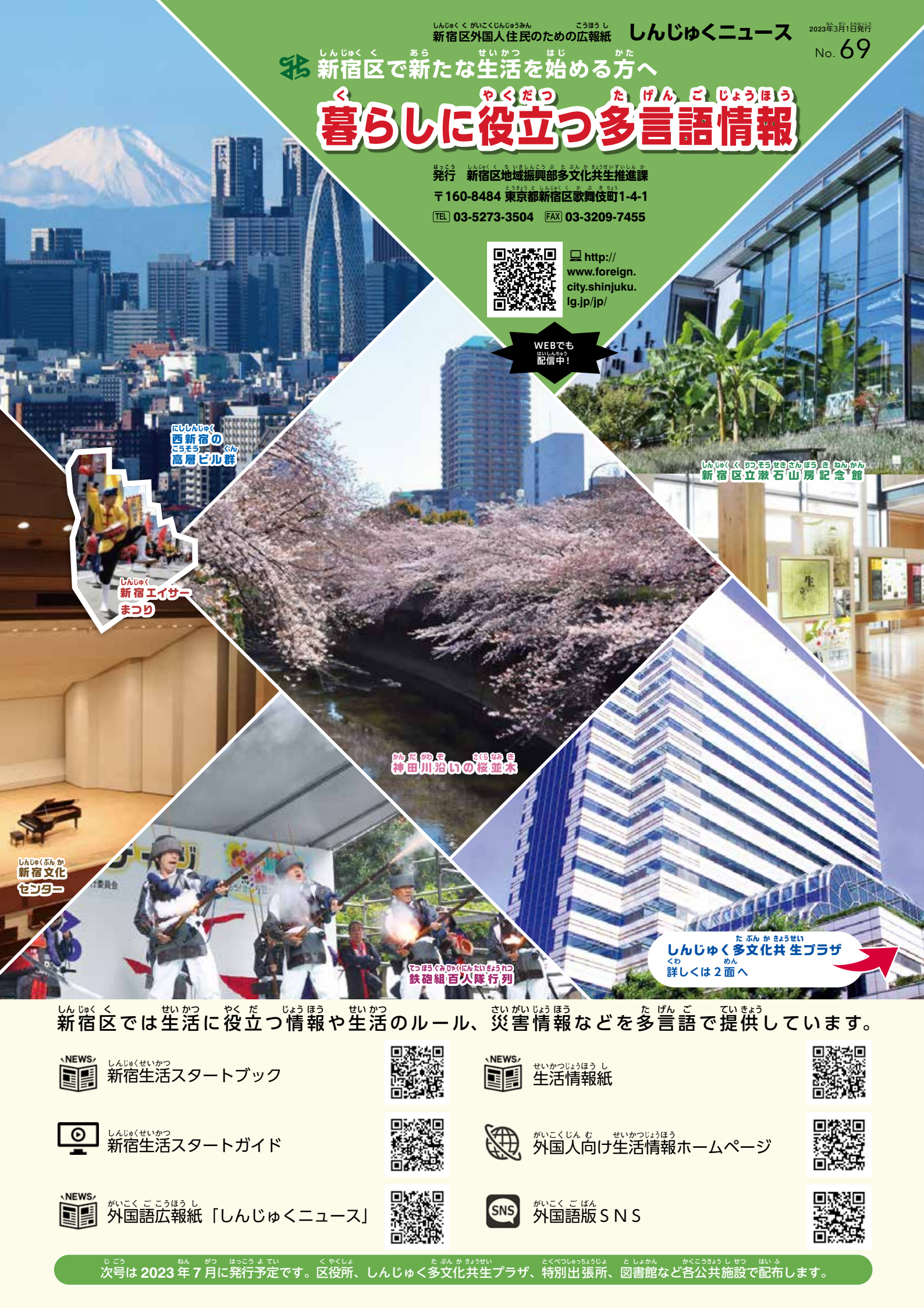
にしんじゅく 西新宿の 高層ビル群