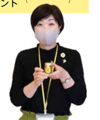
「うちの子（ミツバチ）たちが可愛い！」と熱い思いを語ってくれました。