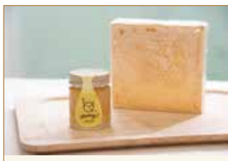
(左) 新宿しQハニー (右) 新宿しQコムハニー

はちみつで季節を味わおう 新宿しQハニーは1種類の花から集めたはちみつではなく、季節ごとに咲くさまざまな花から集めた「百花みつ」。収穫時期により異なる風味を楽しめます。 主な蜜源：サクラ、バラ、ユリノキなど