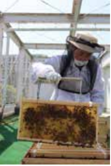
ミツバチの状態をひとつひとつ丁寧に確認します

2019年に始まった「みつばちプロジェクト」は、しんじゅ Quality ※ の事業の一つとして立ち上げられました。このプロジェクトでは、養蜂とはちみつの販売を通じて障害のある方に「働く力を身につける」支援と、地域住民との交流を促進しています。 ミツバチの飼育から採蜜、瓶詰作業、ラベル貼りまですべての工程に障害のある方が携わることで、やる気や