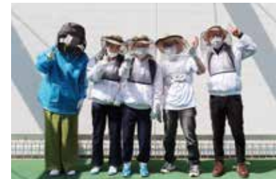
スタッフのみなさん

自信にも繋がっています。 ※身体・知的・精神などに障害のある方が働いている福祉事業所のネットワーク