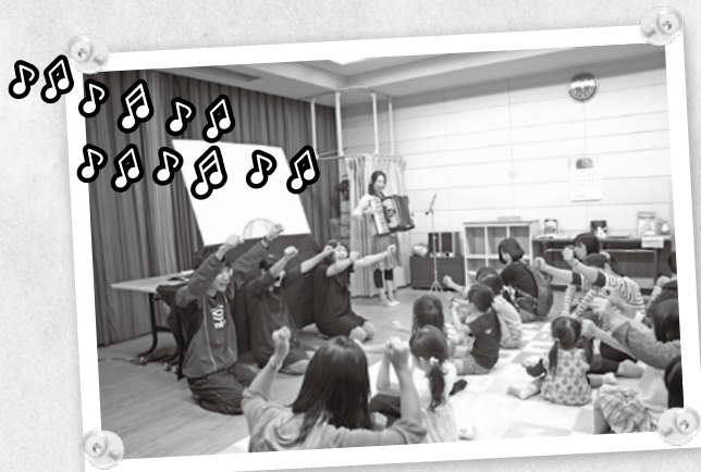
① 大家放声高唱英文歌曲！“If you're happy ~♪” 气氛空前热烈！

当天一共 37 人参加，大家一起完成布偶贴，并用英语进行了合唱。孩子们最开始比较紧张，但受到布偶贴上生动的绘画与文字吸引逐渐变得活跃，结束时大家还用英语进行大合唱，将活动推向高潮。