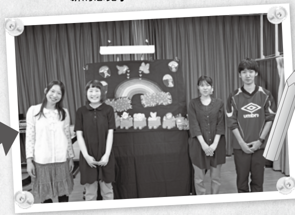
④ 采访为大家演出布偶贴的“蜗牛”剧团成员。 “看到大家欢乐的笑脸，非常开心！”

用多种语言欣赏歌曲和戏剧，体验不同特色的文化。还是交新朋友的绝好机会♪ 敬请各位读者前来参加！