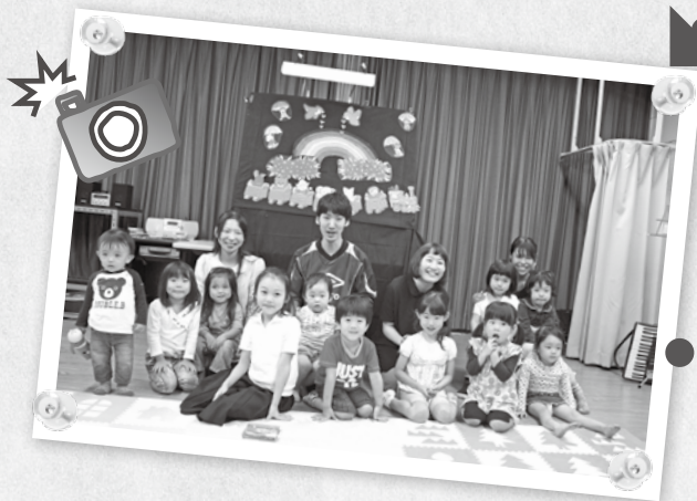
③ 最后大家拍照留念♪ “太开心了！”、“还想再来！”