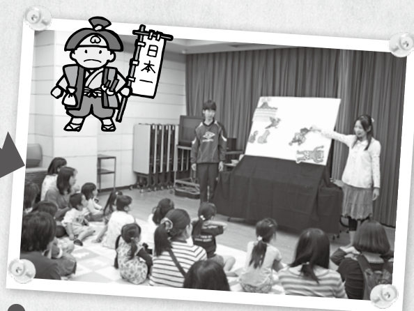
② 用英语为大家演出桃太郎的布偶贴。 广为人知的传说故事用英语演出，给人耳目一新的感觉♪