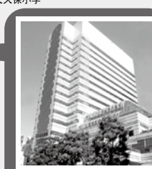
新宿多文化交流广场 (Hygeia 11 楼)