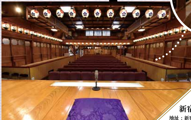
▲全部为自由入座！可选择自己喜欢的位置。