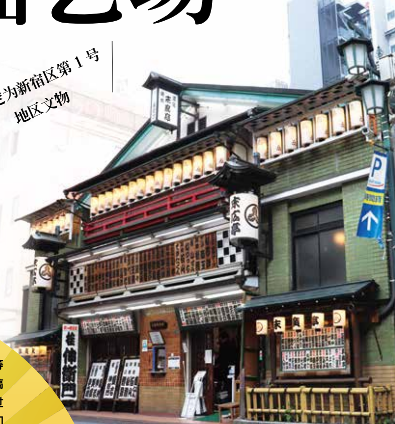
▲是都内唯一的木造曲艺场建筑

是可以欣赏以落语为首，包含相声、魔术、曲艺等各种节目的场所。全年无休每天公演，任何人均可前往观看。敬请在充满日式风情的空间中体验日本的传统节目！