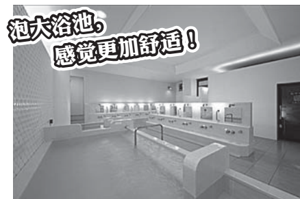
泡大浴池，感觉更加舒适!

钱汤是在宽敞的浴池内轻松泡澡的公共浴室之一，也称为“町内澡堂”，对于当地人们的交流，增进健康发挥着巨大的作用。