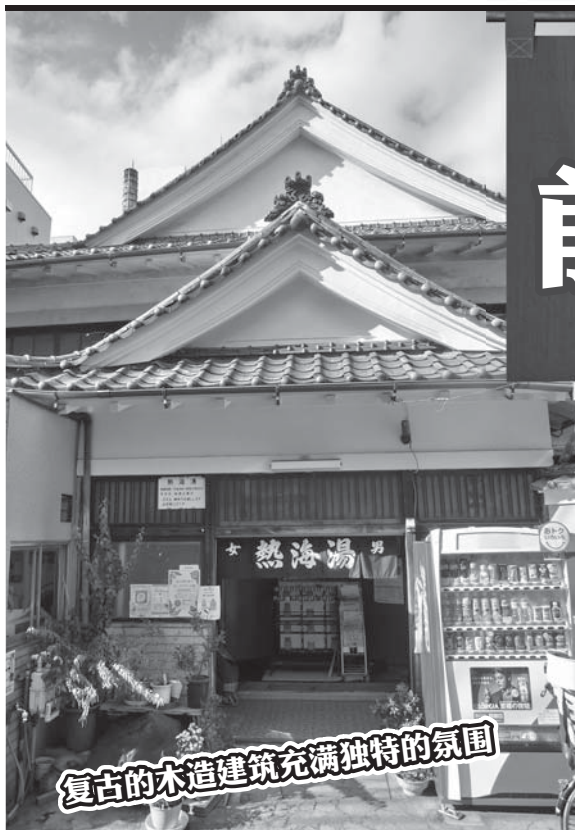
复古的木造建筑充满独特的氛围

Website http://www.foreign.city.shinjuku.lg.jp/cn/