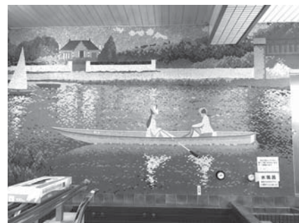
墙壁上绘制的广阔画卷