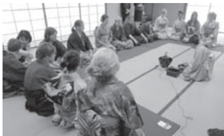
以正座方式学习茶道

全体人员以正座姿势围坐着学习茶道手艺, 并品尝了茶和日式点心。青少年们听不太懂日语, 由同声翻译通过麦克风口译为德语, 青少年们通过耳机进行收听。