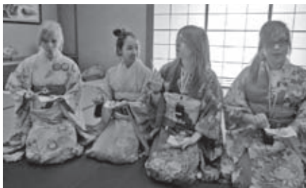
品尝日式点心。大家似乎不太会使用牙签。