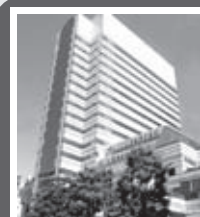
新宿多文化交流广场 (Hygeia 11楼)